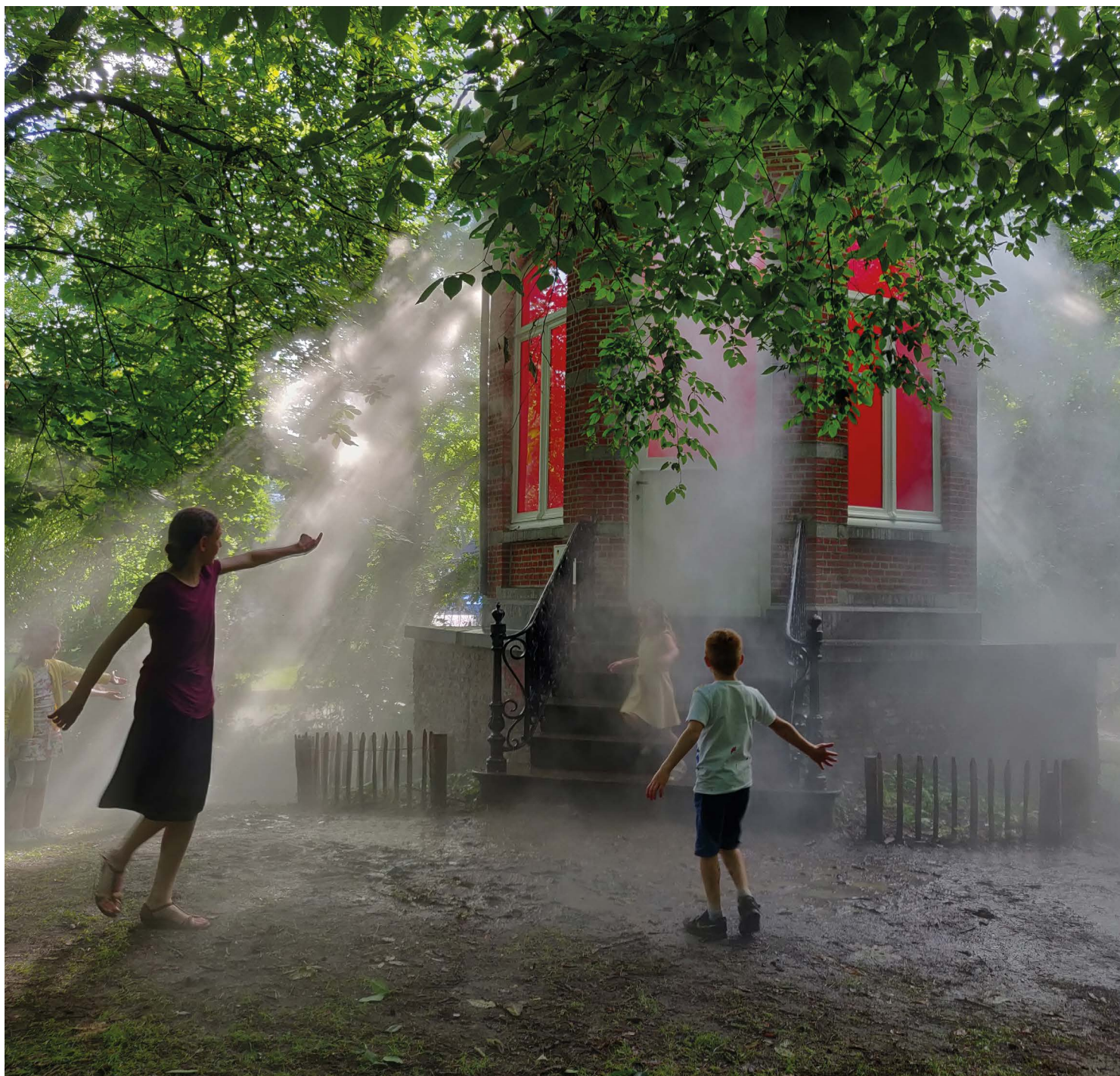
Céleste Boursier Mougnot, Relais in Wevelgem, 2019.